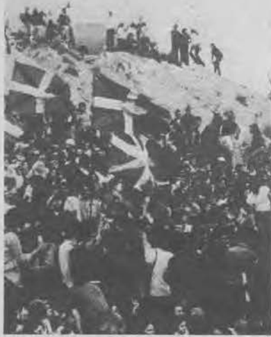
XENTE E IKURRIÑAS Cooficializa-lo todo

O manifesto dirixido ó Goberno e máila opinión pública era unha declaración de principios pra facer máis viábel o emprego a decote do euskera e facilitar tamén a práctica coa cooficialidade solicitada. «Non percuramos, dixeron algúns promotores a TEIMA, unha cooficialidade sóio de palabra, senón unhas cousas mínimas pra dármonos conta de que é certo, pra comprobar que a cooficialidade pódese percurar na realidade». A saída do pobo á rúa o día 22 pasado servíu pra presentala cooficialidade do euskera dun xeito solemne.