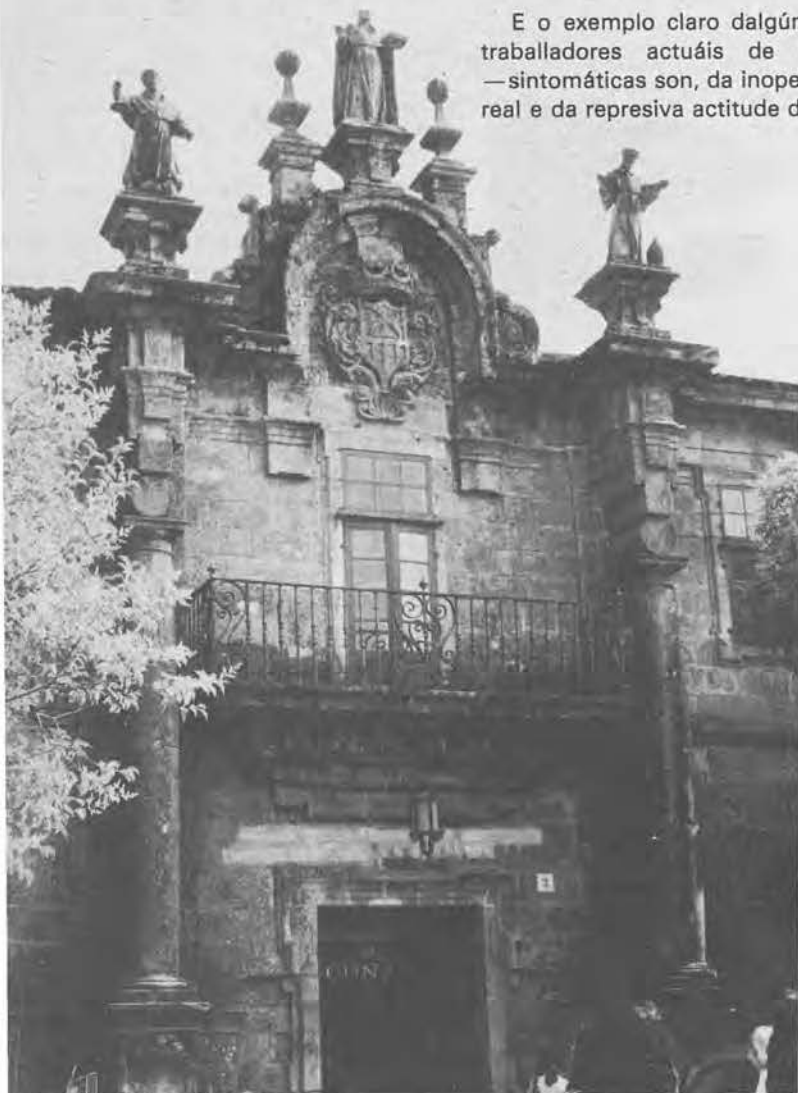
Conxo: tolear ós talos

A medio e longo prazo, o Sico-Social tenta a consolidación do equipo médico e a súa descentralización cara un achegamento ás zonas máis alonxadas, consolidando tamén a súa situación económica dun xeito independente pra potenciar, noutros lugares, o comenzo de experiencias semellantes. Trátase, sen dúbida, dunha alternativa galega e democrática.