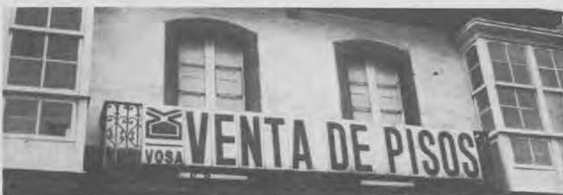
VOSA, CHEGAR E ENCHER Poñe-lo carteliño e xa está.

Entre tanto ¿ónde van os executivos de VOSA que, noutro tempo, campeaban Ferrol abaixo con negocios das estrelas?