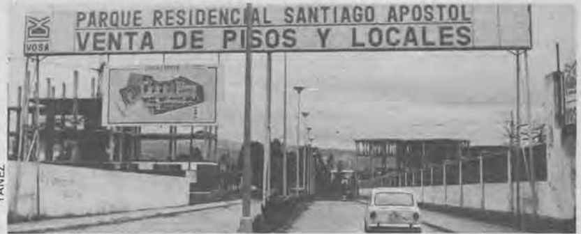
PARQUE, SI; RESIDENCIAL, NON TANTO

O inversor, ó ver no seu contrato o número da póliza, maxinaba con frecuencia de se atopar a resguardo e, en xeral, non seguía a le-las outras cláusulas nas que se explicaba o seu dereito ó apéndice. Somentes