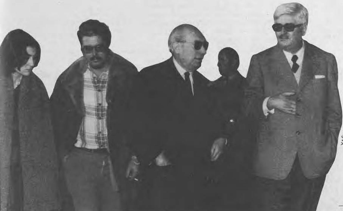
—ADRIO, CON TIERNO —Cobertura nacional e estatal

A posición de Galicia en todo isto, como consecuencia da súa marginación é inda máis complexa. O verdadeiramente esencial é comprender que no xogo que se está xa a xogar, ninguén pode face-lo que «lle dá a gaña». Hai pois auténticas regras. Dos actores principais (Goberno e oposición «respetábel») ningún ten un interés, polo menos prioritario, no desenrolo de Galicia. E nembargantes, Galicia ten «chance», precisamente porque ninguén, nin siquiera os actores principais de común acordo, está en condicións de operar sen «cubrirse as costas».