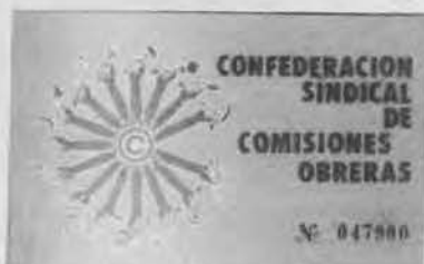
SINDICATOS ESTATALES CON CARNET As nacionalidades, fora

Antes, cando a clase política se reunía pra decidir as ataduras que endexamáis se desatarían, a España real iba ó futbol, contaba chistes verdes ou falaba dos negocios porcos que xa non se descubrirían. Agora, mentres uns señores que aínda se chaman procuradores en Cortes, cren discutir no hemicycle unha reforma sindical da que ninguén fai caso, a verdadeira España oficial deulle-las costas e dálle voltas entre os bastidores ó futuro deste país cheo de demócratas repentinos. Verán.