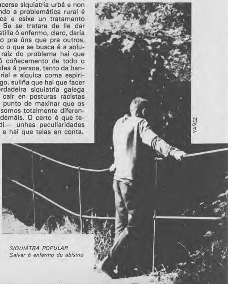
SIQUIATRA POPULAR Salvar ó enfermo da abisma