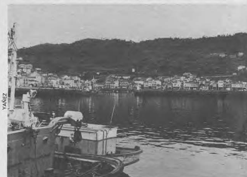
OS BARCOS, NO PORTO A burocracia, en terra

Hai quen pensa —Xiz recolle esa opinión— que habería unha solución intermedia, no mantemento da actual oficina na capital e a apertura de oficinas locais debidamente capacitadas pra decidir e resolver problemas. O que non parece posible de ningún xeito que se mire, é que o Instituto Social da Mariña radique nunha cidade a cen kilómetros do mar.