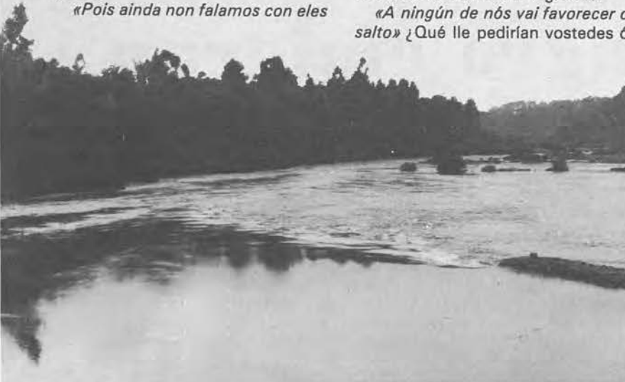
QUEREN FACER UN SALTO NO RIO MIÑO

¿Cál é a alternativa? Deixar sin efecto o proxecto do salto e, polo de pronto, rexeitar xa o procedemento de urxencia, din os veciños na antedita instancia. «De calquer xeito —fala o señor alcalde de Arbo— a cousa non fixo máis que empezar aínda. Isto non é máis que o principio». Pro é un vello conto con acedias esperencias noutras partes. A historia pode volver a repetirse eiquí. «Salmos da Celulosa, que cáseque non o creíamos. E ven agora isto». ¿Cómo se enteraron os veciños? Un deles por un casual, viu no axuntamento de Arbo, «esposto a información pública», o «expediente y proxecto...» Preguntóu. Alguén lle fixo unha copia pra levar á parroquia. TEIMA mesmo foi testigo de xentes que non sabían nada do salto e enteráronse cáseque por nós. Esta é outra. Pro a cousa non fixo máis que empezar. «Non queremos o salto. O salto nada ten que ver con nós, nin con esta parte. Tampouco son pra nós os beneficios. ¿E qué non hai outra maneira de trager o progreso?» (as respostas, están todas recollidas literalmente en cinta magnetofónica).