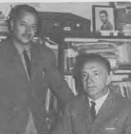
POUSA ANELO CON BLANCO Retrospectiva argentina

Segunda.— As canas destes híbridos teñen gran riqueza en azucre. Dos primeiros «azucarados» conseguidos por nós nos anos cincuenta ós que outemos hoxe, hai unha millora destacada tanto en colleita coma en riqueza en azucre a favor dos actuais.