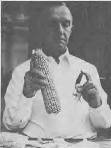
BLANCO, CO SEU MILLO Liñas puras, espigas grandes